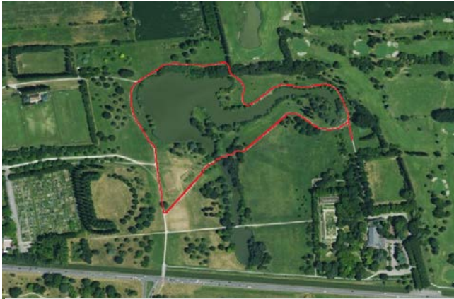
Figura 1. Percorso ad anello svolto nel parco urbano “G. Bassani”.

scontra una buona diversità floristica con presenza di olmo, sanguinella, biancospino, bagolaro, salice bianco, sambuco, prugnolo, pioppo bianco, pioppo nero, gelsi, frassini e farnie, mentre le sponde del laghetto principale sono largamente interessate da un canneto con Phragmites australis .